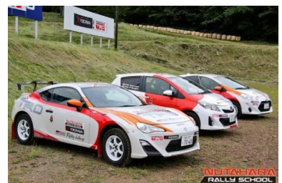
※写真はイメージ車両です